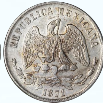
108. KM# 408.7 – Peso 1871 San Luis Potosí Pi O. AU. Buena acuñación, tenue brillo, tonificación guinda oscuro en ciertas áreas, leves marquitas y rayitas.....$2,000.00