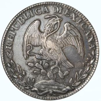
70. KM# 377.8 (D&P-Go22) – 8 Reales 1840 Guanajuato Go PJ. XF. Bien acuñada, detalles de choque de troquel distinguibles en anverso, profusa pátina oscura ligeramente descubierta en puntos altos.....$2,000.00