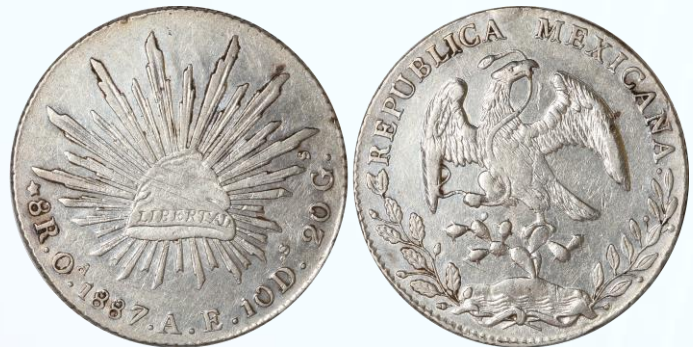
77. KM# 377.11 (D&P-Oa32) – 8 Reales 1887/6 Oaxaca Oa AE. XF. Sobrefecha clara siendo lo normal para esta fecha, líneas de ajuste sobre el gorro, múltiples marquitas y rayoncitos, pequeñas manchitas oscuras en bordes de diseño.....$1,200.00