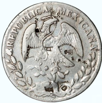
58. KM# 377 (D&P-As08) – 8 Reales 1870 Álamos A DL. F. Pequeños chops en ambas caras, evidente debilidad sobre el gorro, marquitas y líneas de limpieza.....$1,100.00