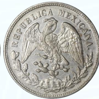
109. KM# 409 – Peso 1903 Cn FV. XF+. Ensayador escaso, buena acuñación de centros, brillo en campos, numerosas marquitas y rayoncitos.....$1,000.00