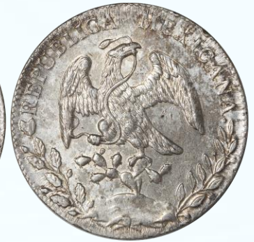
61. KM# 377.2 (D&P-Ca70) – 8 Reales 1887 Chihuahua Ca MM. AU+. Buena acuñación, brillo, múltiples marcas y rayoncitos, ligera tonificación oscura.....$1,500.00