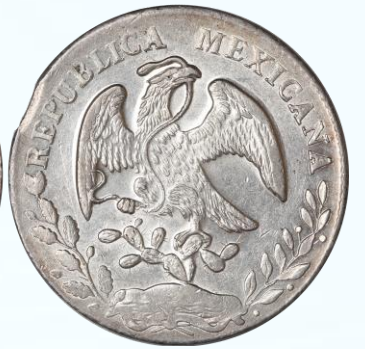
73. KM# 377.9 (D&P-Ho14) – 8 Reales 1872 Hermosillo Ho PR. AU+. Brillo y lustre en campos, leves marquitas y hairlines poco notables a simple vista, pequeño defecto de fin de riel en canto, una fecha bastante difícil de hallar en altos grados, sutil tono color caramelo en periferias.....$1,800.00