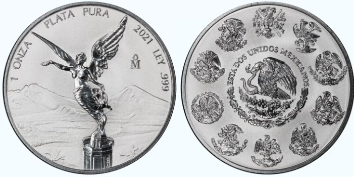
150. Onza Libertad 2021 Mo Reverse Proof. PCGS PR70.....$3,000.00