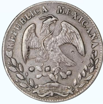
57. KM# 377 (D&P-As07) – 8 Reales 1869 Álamos A DL. VF. Diminutos chops, cierta debilidad en la base de los rayos, múltiples marquitas en ambos lados, rayoncitos en anverso, tonificación oscura.....$1,500.00