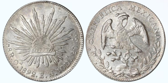
78. KM# 377.11 (D&P-Oa37) – 8 Reales 1892 Oaxaca Oa EN. AU+. Restos de lustre en ambos lados, ligeramente débil de centros, líneas de ajuste y rayoncitos sobre el gorro.....$1,400.00