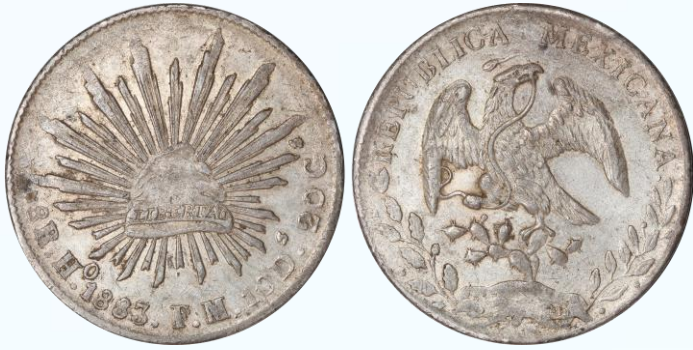
75. KM# 377.9 (D&P-Ho29) – 8 Reales 1883 Hermosillo Ho FM/JA. XF. Sobre ensayador tenue, aunque distinguible con es en todos los ejemplares, marquitas, restos de sedimento adherido en bordes de relieves.....$1,300.00