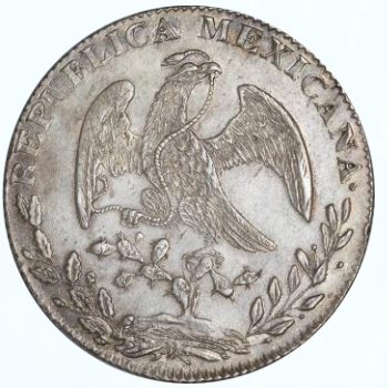
71. KM# 377.8 (D&P-Go27) – 8 Reales 1844 Guanajuato Go PM. AU. Destacada acuñación, centros perfectamente bien definidos, algo sumamente difícil de observar particularmente para estas fechas. Finísimas líneas de limpieza en ambos lados, ligera pátina oscura, pequeñas manchitas y retos de adhesivo a la 1:00 en reverso.....$1,600.00