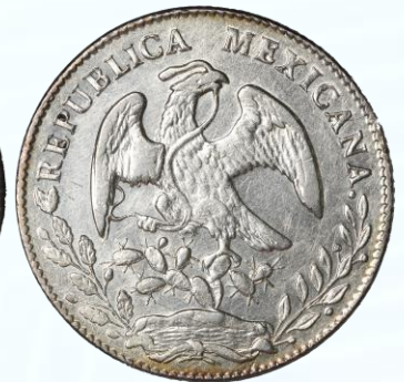
62. KM# 377.3 (D&P-Cn21) – 8 Reales 1864 Culiacán C CE. AU. Brillo especialmente en contornos de relieves, numerosas rayitas de limpieza en ambas caras, tonificación purpura en periferia de reverso.....$1,800.00