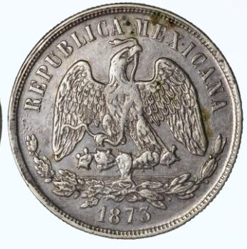
107. KM# 408.5 – Peso 1873 México Mo M. XF. Suave y uniforme pátina oscura, marquitas y rayoncitos, el más notable sobre el 7 en reverso, pequeñas manchitas en anverso.....$800.00