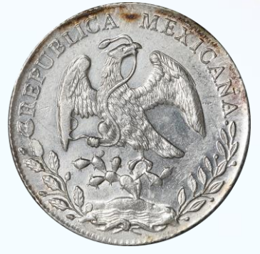
72. KM# 377.8 (D&P-Go75) – 8 Reales 1892 Guanajuato Go RS. UNC. Campos con bastante lustre y brillo; rayitas en campos.....$1,700.00