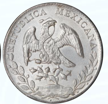
74. KM# 377.9 (D&P-Ho27) – 8 Reales 1882 Hermosillo Ho JA. AU. Variedad con O después de la H en ceca, excelente acuñación, brillo y restos de lustre, líneas de limpieza del lado del gorro, cremos presuntamente para remover manchitas oscuras en superficie.....$1,600.00