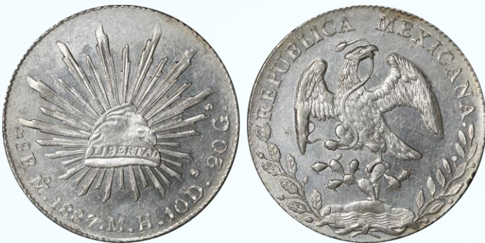
76. KM# 377.10 (D&P-Mo72) – 8 Reales 1887 México Mo MH. UNC. Presente esa reflectividad que caracteriza a las piezas nuevas de las últimas dos décadas de esta emisión, buena acuñación por ambos lados con rayitas de una tenue limpieza.....$1,600.00