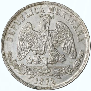
106. KM# 408.5 – Peso 1872 México Mo M. UNC. Excelente acuñación, finos detalles, brillo y restos de lustre, rayitas de limpieza, talloncito cercano al borde a las 11:00 en reverso.....$1,800.00