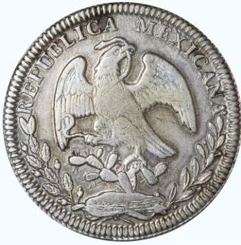
69. KM# 377.8 (D&P-Go11) – 8 Reales 1830 Guanajuato Go JM. VF. Cuños estilo 1829-1830. Leves marquitas y líneas de limpieza, tonificada en bordes de diseño.....$1,800.00