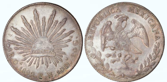
79. KM# 377.11 (D&P-Oa37) – 8 Reales 1892 Oaxaca Oa EN. AU. Reminiscencias de brillo en contornos de diseño, ligera debilidad y líneas de ajuste en anverso, densa pátina de tonos salmón en superficie que la hace lucir más opaca en fotografía.....$1,200.00