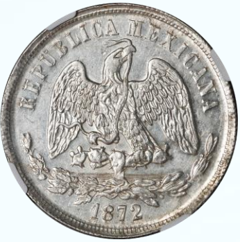
105. KM# 408.5 – Peso 1872 México Mo M. NGC UNC Cleaned. Excelente acuñación, brillo en campos, rayitas por limpieza principalmente en reverso.....$2,000.00