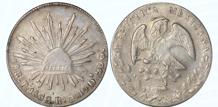
80. KM# 377.12 (D&P-Pi50) – 8 Reales 1863 San Luis Potosí Pi RO. VF+. Cuños estilo 1863-1864, acuñación débil, múltiples marquitas y rayoncitos principalmente del lado del águila, pátina oscura.....$1,500.00