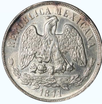
104. KM# 408.5 – Peso 1871 México Mo M. XF+. Buena acuñación, leves pero numerosas marquitas en ambas caras, limpiada.....$1,500.00