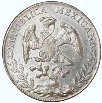
59. KM# 377 (D&P-As30) – 8 Reales 1890 Álamos As ML. AU. Leves marcas en campos y sobre el gorro.....$1,200.00