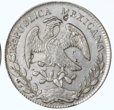
60. KM# 377.2 (D&P-Ca51) – 8 Reales 1875 Chihuahua Ca MM. XF. Pequeños chops en ambas caras, líneas de limpieza en campos.....$1,000.00