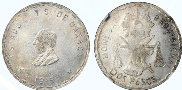
409. KM# 747.1 (GB365) – 2 Pesos 1915 Oaxaca. NGC MS61. Denominación en letras grandes, sin punto al final de “OAXACA” ni después de fecha, buen brillo, debilidad habitual en centros, ligeros rayoncitos en anverso, manchitas oscuras en periferia de reverso.....$6,000.00