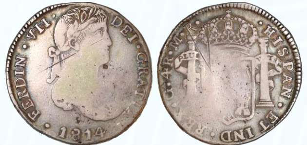
126. KM# 102.2 (A&C# 1039) – 4 Reales 1814 Guadalajara Ga MR. F+. Notable debilidad en centros, un rayón en anverso y dos por reverso, suave tonificación acrecentada en periferias.....$2,400.00