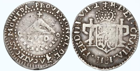
123. KM# 186 (A&C# 996) – 2 Reales 1811 LVO, Zacatecas. F. Primer tipo con fecha invertida, escudo de armas locales, debilidades centrales y patinado en periferia.....$5,000.00