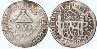
120. KM# 180 (A&C# 480) – Medio Real 1811 LVO, Zacatecas. F. Primer tipo con fecha invertida, escudo de armas locales, único par de cuños empleados para este año, pérdida de leyendas en periferia, ligeras oxidaciones, cospel poco doblado como la mayoría de los ejemplares de este tipo.....$5,000.00