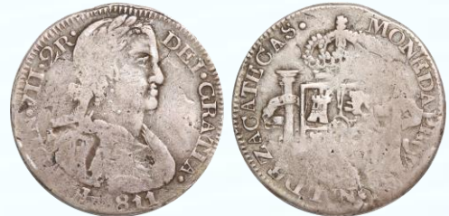
125. KM# 188 (A&C# 998) – 2 Reales 1811 Provisional de Zacatecas. F+. Primera fecha con diseño de busto armado, bien centrada, leyendas virtualmente completas, habituales vanos, sin mayores daños, pátina oscura concentrada en bordes de relieves. Ex. Richard Long, Sale 92, Lot.477 (28 de Mayo, 2003) .....$4,000.00