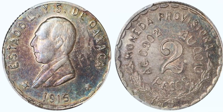
407. KM# 745 (GB351) – 2 Pesos 1915 Oaxaca. PCGS MS62. Variedad con denominación numérica al centro en anverso, canto estriado, iniciales “T.M”