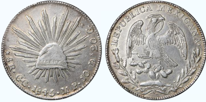
295. KM# 377.7 (D&P-GC02) – 8 Reales 1845 Guadalupe y Calvo GC MP. XF. Variedad de corro curvo y águila de cola cuadrada, la primer pieza acuñada con este particular estilo, los troqueles fueron producidos localmente y utilizados solo durante dos años, buena acuñación, plumaje completo, aunque ligeramente desvanecido en puntos de contacto, sutiles tonos ámbar en periferia, rayitas de limpieza y golpecitos en canto.....$20,000.00