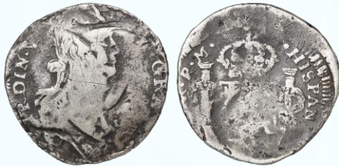
122. KM# 92.3 (A&C# 773) – 2 Reales (1812) Durango (D) RM. G. Subtipo de busto armado muy característico de 1812 al igual que las iniciales del ensayador en la cual la base de la R es muy robusta y la M se encuentra pegada a la columna, denominación rara, siempre cruda al igual que toda la emisión de 1812, cospel irregular en cuanto a forma con múltiples defectos en bordes, ambas iniciales del ensayador presentes, vestigios de cordón colonial en canto, marquitas y rayones como es de esperarse, patina oscura acrecentada en bordes de relieves.....$5,000.00