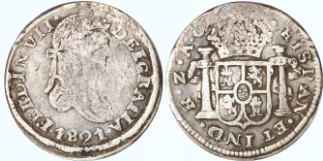
121. KM# 74.3 (A&C# 496) – Medio Real 1821 Zacatecas Z AG. F. Ensayador raro para esta fecha, desvanecimiento de relieves en busto por aplastamiento, múltiples marquitas, pátina oscura en periferia y en bordes de diseño, a pesar de lo anterior los detalles son bastante buenos en cuanto a leyendas, poco más débil en busto pero completo.....$3,000.00