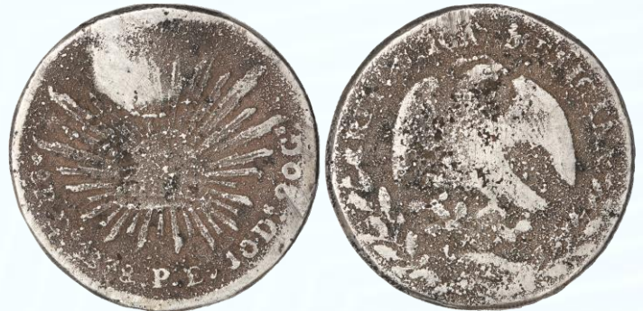
412. KM# 768.1 (GB406) – Peso Buelna-Carrasco, Sinaloa (1913-1915). Sin duda uno de los atractivos del tipo es poder reunir ejemplares de distintos moldes fabricados tomando correlativamente como base monedas de distintas fechas y cecas, para esta pieza en particular la moneda a usar fue un 8 Reales Durango 1878 PE (KM# 377.4), destaca su fundición con todos los elementos de diseño identificables, estrías en canto realizadas aparentemente a máquina en ciertas áreas, remoción de copa de vaciado de 11:00 a 1:00.....$6,000.00