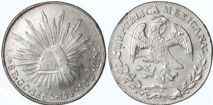
297. KM# 377.7 (D&P-GC07) – 8 Reales 1850 Guadalupe y Calvo GC MP. XF. Buena acuñación y definición en centros, ínfimas manchitas verdes en superficie por contacto con algún cartoncillo o plástico degradado, múltiples marcas y rayoncitos, limpiada. Popular y siempre en alta demanda.....$15,000.00