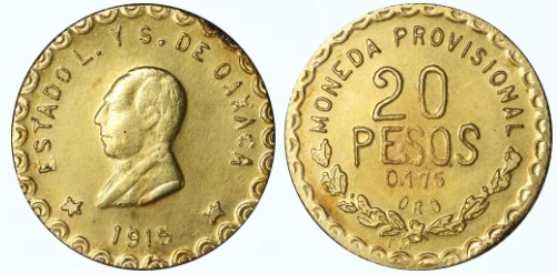
411. KM# 754 (GB377) – 20 Pesos 1915 Oaxaca. AU+. Considerablemente bien acuñada para el tipo, ciertas tonalidades caramelo-ámbar que resultan de la aleación con un significativo porcentaje de plata, finas rayitas de limpieza en campos.....$30,000.00