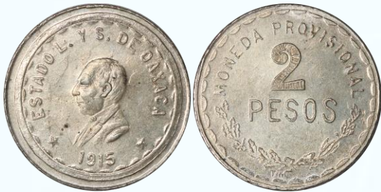
408. KM# 744 (GB357) – 2 Pesos 1915 Oaxaca. UNC. Variedad con denominación numérica, 2 recto sombreado en su interior, iniciales TM en exergo, el cuño de anverso evidentemente de menor diámetro corresponde al mismo usado para el 20 Centavos (GB327), excelentemente bien acuñada, bastante brillo, mínimas marquitas y rayoncitos casi indetectables a simple vista, sutil tonificación.....$6,000.00

en exergo, brillo en campos que aviva tonalidades purpuras celestes a contraluz.....$8,500.00