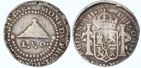
124. KM# 187 (A&C# 997) – 2 Reales 1811 LVO, Zacatecas. VF. Segundo tipo, ligeramente descentrada, de lo contrario con leyendas completas, pátina oscura acentuada en bordes de relieves, marquitas y rayoncitos.....$6,000.00