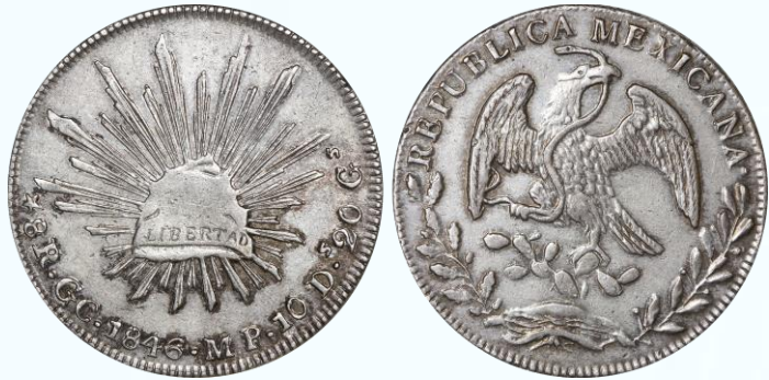
296. KM# 377.7 (D&P-GC03) – 8 Reales 1846 Guadalupe y Calvo GC MP. XF. Variedad de gorro y águila normal, relevante acuñación para el tipo, íntegros detalles, un agradable ejemplar de este representativo y buscado tipo, pátina oscura acentuada en bordes de diseño, leves marquitas, limpiada en algún momento.....$20,000.00