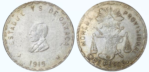
410. KM# 747.1 (GB365) – 2 Pesos 1915 Oaxaca. AU+. Denominación con letras grandes, debilidad habitual en centros, sutilmente tonificada, mínimos rayoncitos en anverso. ....$3,000.00