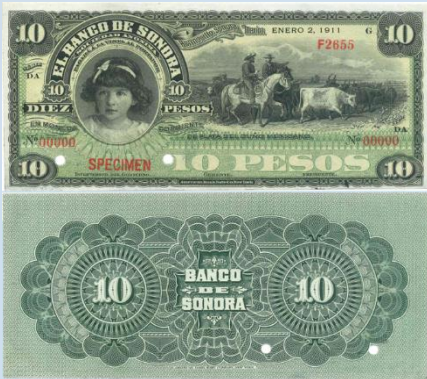
20. M508s2 – 10 pesos El Banco de Sonora 1911, SPECIMEN. AU+. 184 x 82mm. Serie DA. Folios en ceros, horadado. Impreso por American Bank Note Co. New York, del 2 de Enero de 1911. Marcas de grapa cercanas al borde inferior izquierdo.....$1,200.00