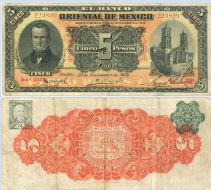
14. M460c – 5 Pesos El Banco Oriental de México, 1910. F. 184 x 82mm. Serie P. CILXXXVIII. Impreso por American Bank Note Co. New York, del 23 de Noviembre de 1910. Tres dobleses verticales, ligera suciedad y arrugas en bordes.....$260.00