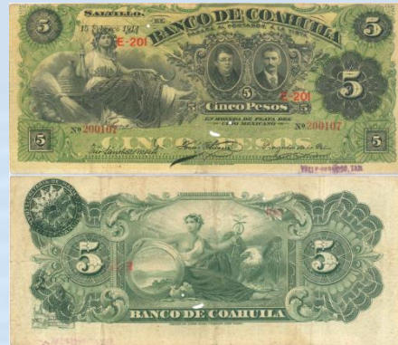
5. M167c – 5 Pesos El Banco de Coahuila, 1914. VG+. 184 x 80mm. Serie E-201. Impreso por American Bank Note Co. New York, del 15 de Febrero de 1914. Tres ligeros dobleces verticales y uno en horizontal, apollillado.....$300.00