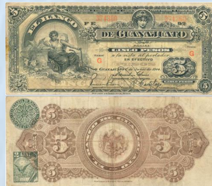
12. M358 – 5 Pesos El Banco de Guanajuato, 1914. F. 174 x 75mm. Serie G. Impreso por Bouligny & Schmidt Sucr. Mexico, del 01 de Junio de 1914. Tres dobleces verticales y uno en horizontal.....$500.00