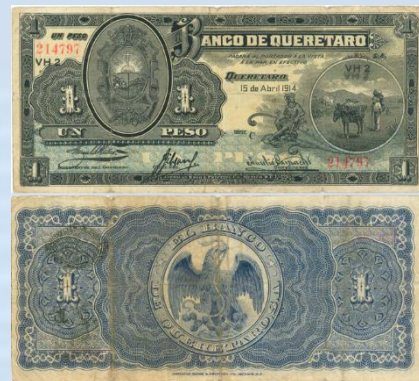
17. M481 – 1 Peso El Banco de Querétaro, 1914. VG. 184 x 82mm. Serie C. Impreso por American Book & Printing Co Mex D.F., del 15 de Abril de 1914. Tres dobleses verticales, un doblez horizontal.....$600.00