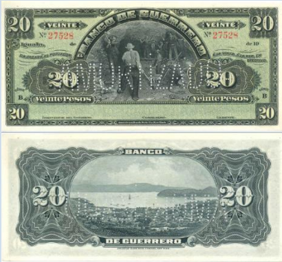
13. M363r – 20 Pesos El Banco de Guerrero, REMINDER. AU+. 184 x 82mm. Impreso por American Bank Note Co. New York. Horadado con leyenda “AMORTIZADO”...$500.00