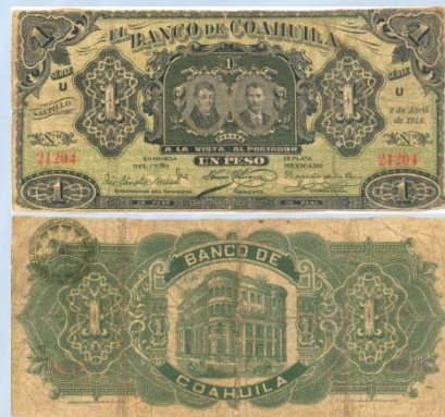
6. M175 – 1 Peso El Banco de Coahuila, 1914. G. 180 x 90mm. Serie U. Impreso por American Book & Printing Co Mex D.F., del 2 de Abril de 1914. Numerosas arrugas, evidente suciedad y desgaste por circulación normal.....$400.00