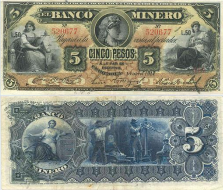
1. M131h – 5 Pesos El Banco Minero, 1914. F+. 167 x 72mm. Serie L.50. Impreso por American Bank Note Co. New York, del 13 de Abril de 1914. Arrugas y 3 principales dobleces verticales, ligera suciedad en reverso.....$300.00