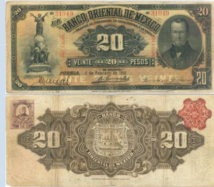
16. M462c – 20 Pesos El Banco Oriental de México, 1910. VG. 184 x 82mm. Serie O. CILXXXIV. Impreso por American Bank Note Co. New York, del 3 de Febrero de 1910. Firmas autógrafas, tres dobleses verticales, suciedad y desgaste generalizado.....$800.00