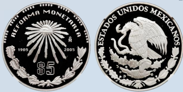
231. KM# 769 – $5 Pesos 2005 Mo Reforma Monetaria de 1905. NGC PF-69 ULTRA CAMEO.....$5,000.00