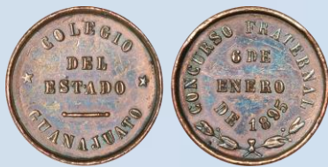
232. Grove 307b – Colegio del Estado de Guanajuato, 1895. XF. Bronce, acuñada con motivo del Concurso Fraternal del 6 de enero de 1895, ligeras marquitas, 20 milímetros de diámetro, 6.8 gramos de peso.....$900.00