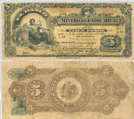
3. M154 – 5 Pesos El Banco Minero de Chihuahua, 1914. VG. 184 x 82mm. Serie L-53. Impreso por Bouligny & Schmidt Sucr. México, del 09 de Junio de 1914. Arrugas en bordes, desgaste y suciedad generalizada por circulación, tres notables dobleces verticales.....$200.00