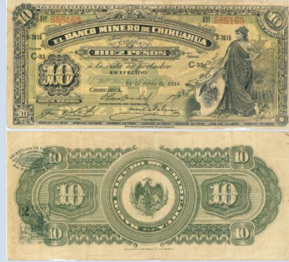
4. M155 – 10 Pesos El Banco Minero de Chihuahua, 1914. F. 184 x 82mm. Serie C-33. Impreso por Bouligny & Schmidt Sucr. México, del 24 de Junio de 1914. Tres principales dobleces verticales.....$300.00