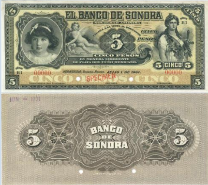
19. M507s2 – 5 Pesos El Banco de Sonora 1901, SPECIMEN. AU+. 184 x 82mm. Serie B1. Folios en ceros, horadado. Impreso por American Bank Note Co. New York, del 1 de Julio de 1901. Ínfimas arrugas.....$800.00