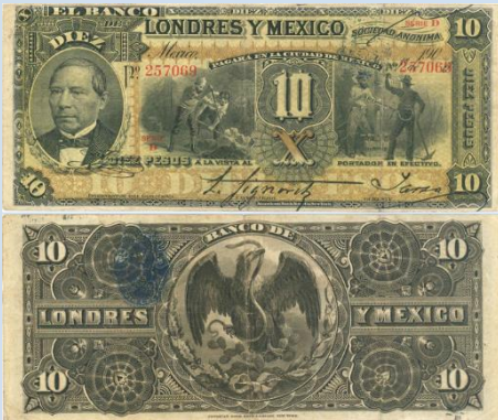
8. M272d – 10 Pesos El Banco de Londres y México, 1906. F. 182 x 80mm. Serie D. Impreso por American Bank Note Co. New York, del 1 de Mayo de 1906. Arrugas, tres principales dobleces verticales.....$300.00