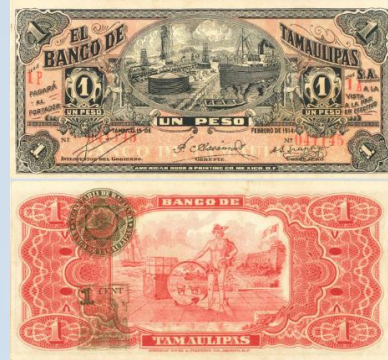
22. M519a – 1 Peso El Banco de Tamaulipas, 1914. AU+. 151 x 72mm. Serie 1P 1A. Impreso por American Book & Printing Co Mex D.F., del 15 de Febrero de 1914. El más mínimo desgaste en esquinas.....$2,400.00

del 01 de Julio de 1901. Marcas de grapa en borde izquierdo.....$1,800.00