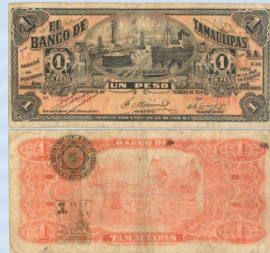
23. M519a – 1 Peso El Banco de Tamaulipas, 1914. G. 151 x 72mm. Serie 1A 1J. Impreso por American Book & Printing Co Mex D.F., el 15 de Febrero de 1914. Numerosas arrugas, suciedad y desgaste por circulación normal.....$400.00