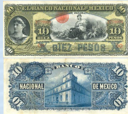
11. M299e – 10 Pesos El Banco Nacional de México, 1913. F+. 184 x 82mm. Serie CN OO. Impreso por Compañía Americana de Billetes de Banco New York, del 24 de Octubre de 1913. Pequeño agujero en centro, tres dobleces verticales.....$300.00