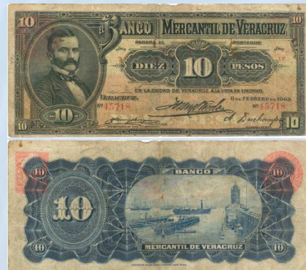
24. M530b – 10 Pesos El Banco Mercantil de Veracruz, 1905. G+. 184 x 82mm. Serie X.6-I.7. Impreso por American Bank Note Co. New York, el 8 de Febrero de 1905. Numerosas arrugas, 3 dobleces verticales, suciedad y desgaste.....$700.00