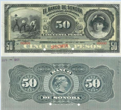
21. M510s2 – 50 Pesos El Banco de Sonora 1901, SPECIMEN. AU+. 184 x 82mm. Serie A1. Folios en ceros, horadado. Impreso por American Bank Note Co. New York-

del 01 de Julio de 1901. Marcas de grapa en borde izquierdo.....$1,800.00