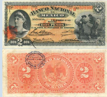
10. M297b – 2 Pesos El Banco Nacional de México, 1913. F. 155 x 70mm. Serie LC CB. Impreso por American Bank Note Co. New York, del 6 de Diciembre de 1913. Múltiples dobleces verticales.....$400.00