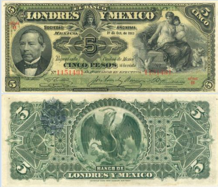
7. M271d – 5 Pesos El Banco de Londres y México, 1913. VF+. 182 x 80mm. Serie H. Impreso por American Bank Note Co. New York, del 1 de Octubre de 1913. Ligeras arrugas, doblez cercano al borde izquierdo.....$300.00