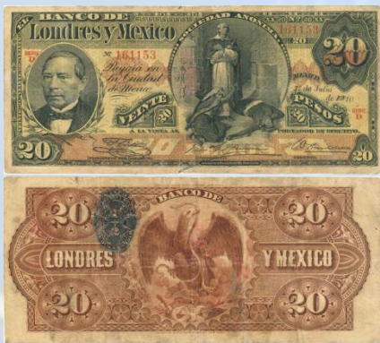
9. M273d – 20 Pesos el Banco de Londres y México, 1910. G+. 182 x 80mm. Serie D. Impreso por American Bank Note Co. New York, del 1 de Julio de 1910. Múltiples arrugas y dobleces.....$600.00