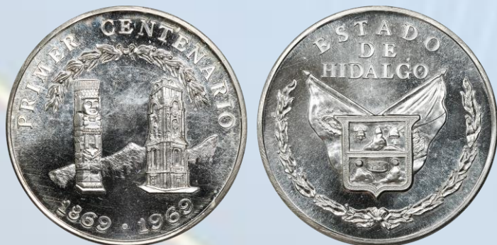
234. Grove 1047a – Primer Centenario del Estado de Hidalgo, 1969 (Mo). UNC. Plata, gran brillo y reflectividad en campos, ínfimas líneas de limpieza casi imperceptibles

a simple vista, 40 milímetros de diámetro, 28.3 gramos de peso.....$800.00