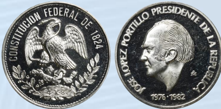
236. Constitución Federal de 1824 - José López Portillo, 1982 Mo. AU+. Plata. Por anverso un águila republicana, en la base del nopal la fecha 4.X.82, reverso con efigie de Jose López Portillo mirando a la izquierda, a un costado la marca Mo, debajo el sexenio 1976.1982, inscripción en canto "RECONOCIMIETOS DE LOS MUNICIPIOS", campos semi espejo, gran brillo, ligeras marquitas, 38 milímetros de diámetro, 26.2 gramos de peso.....$500.00