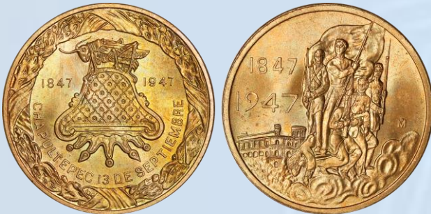
233. Grove 553b – Batalla de Chapultepec, 1947 Mo. UNC. Bronce, brillo y lustre completo, superficies libres de marcas y relieves intactos, 34 milímetros de diámetro.....$500.00