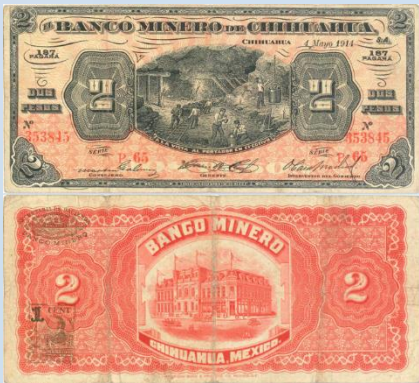
2. M153 – 2 Pesos El Banco Minero de Chihuahua, 1914. F. 184 x 82mm. Serie P 65. Impreso por American Book & Printing Co Mex D.F., del 04 de Mayo de 1914. Tres dobleces verticales.....$200.00