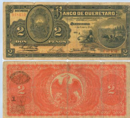
18. M482 – 2 Pesos El Banco de Querétaro, 1914. G. 184 x 82mm. Serie A. Impreso por American Book & Printing Co Mex D.F., del 1 de Enero de 1914. Numerosas arrugas evidente suciedad y desgaste por circulación.....$600.00