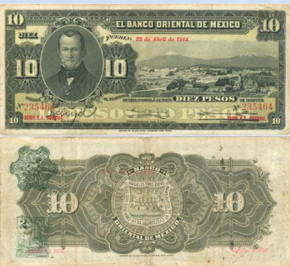
15. M461c – 10 Pesos El Banco Oriental de México 1914. F+. 184 x 82mm. Serie E.E. CCCXVII. Impreso por American Bank Note Co. New York, del 22 de Abril de 1914. Tres dobleses verticales, ligera suciedad y arrugas en bordes.....$500.00